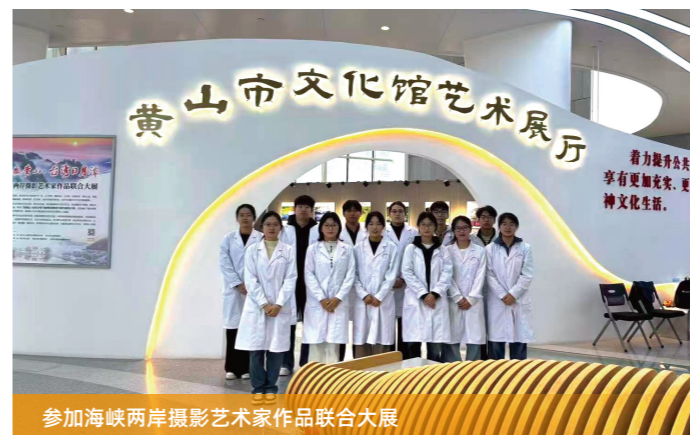
参加海峡两岸摄影艺术家作品联合大展