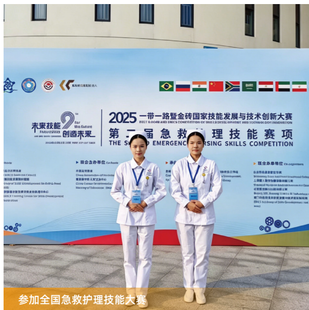
参加全国急救护理技能大赛