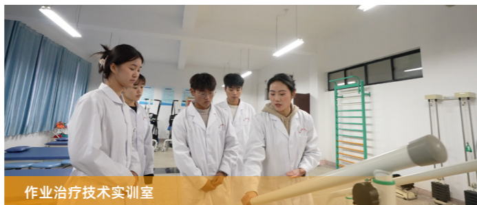
作业治疗技术实训室