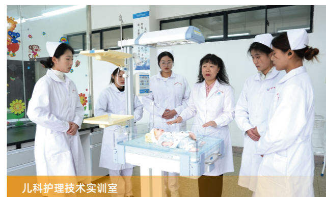
儿科护理技术实训室

【就业方向】 毕业生可在各级综合医院、专科医院、急救中心、康复中心、社区卫生服务中心、养老机构等单位，从事临床护理、社区护理、预防保健、康复指导、健康保健等工作，以“敬佑生命、救死扶伤”为使命，为全民健康保驾护航。近年来，护理专业就业率常年保持在95%以上，多数毕业生就职于长三角地区的优质医疗机构。