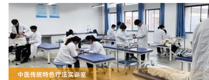
中医传统特色疗法实训室