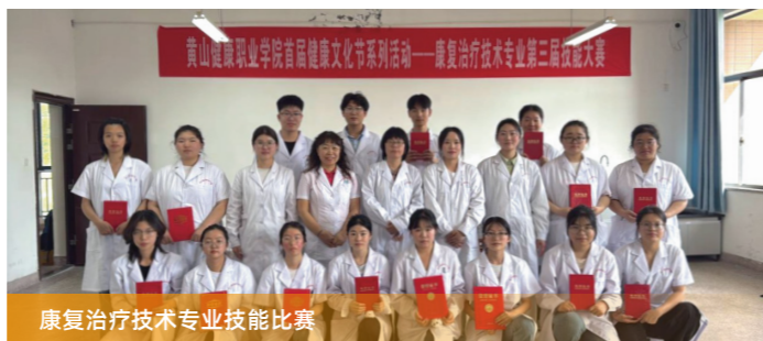
康复治疗技术专业技能比赛

【就业方向】 中医养生康复技术专业学生毕业后主要就业面向为各级综合性医院、社区卫生服务中心、康复保健机构等从事健康咨询、中医保健、中医养生等工作。