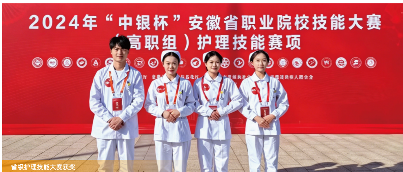
省级护理技能大赛获奖